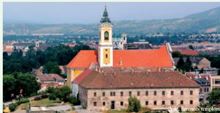
Vác, Ferences templom