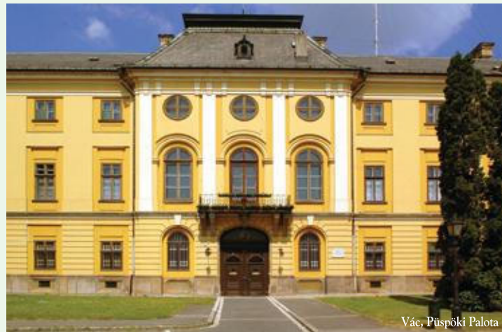
Vác, Püspöki Palota

Látogasson el Ön is hozzánk minél előbb! A Tourinform Iroda a város háziasszonya!