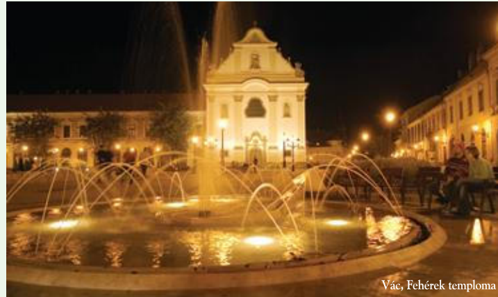
Vác, Fehérek temploma