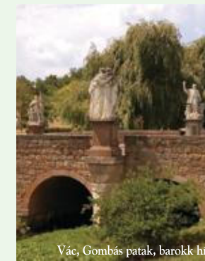
Vác, Gombás patak, barokk híd